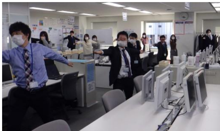
コロナ禍においてもソーシャルディスタンスを意識して 健康促進活動を継続しています。